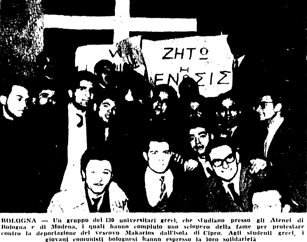
BOLOGNA - Un gruppo del 130 universitari greci, che studiano presso gli Atenei di Bologna, si sono riuniti per protestare contro la deportazione del vescovo Makarios dall'isola di Cipro.