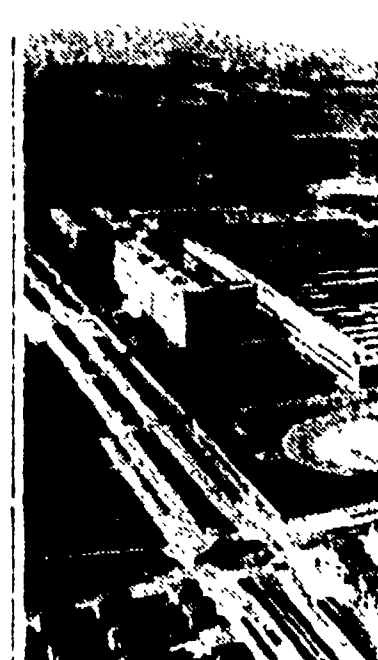
TORINO. — La Mirafiori, la maggiore officina Fiat. Dalla Mirafiori escono ogni giorno 320 utilitarie « 600 », 128 « pulmini 600 » e 210 auto « 1100 » e « 1500 ».

La situazione che si sta creando in una fabbrica FIAT, e in che modo questa situazione si riflette sulla vita dei lavoratori.