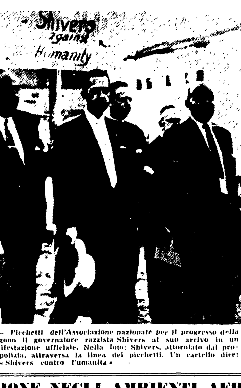
HOUSTON (Texas, Stati Uniti). - Picchetti dell'Associazione nazionale per il progresso della gente di colore (NAACP) accolgono il governatore nazista Shivers al suo arrivo in un college negro, per una manifestazione ufficiale. Nella foto: Shivers, attorniato dal professori del college, e dalla polizia, attraverso la linea dei picchetti. Un cartello dice: « Shivers contro l'umanità ».

Per la salvezza di Alvaro Cunhal Il collettivo della scuola regionale toscana del Partito comunista italiano ha ricevuto il seguente messaggio: « La scuola della vita è una lotta continua. La lotta armata non è ancora del tutto terminata: oggi stesso, settanta partigiani sono caduti in uno scontro con i soldati francesi a Benkaddes... A Parigi, intanto, in previsione del dibattito sulla politica estera del governo, Pineau ha svolto questa mattina una ampia relazione sul suo status di attivista davanti alla Commissione esteri della Assemblée Nationale. Pineau ha fermato l'attenzione dei presenti sui seguenti punti: 1) che i tempi più sono cambiati per quanto riguarda l'oriente e che una prova concreta di una grande evoluzione ideologica è data dal Congresso del Partito comunista dell'Unione Sovietica; 2) che la SEATO è un organismo troppo militare per essere utile. Dove in noi gli sforzi dovranno essere volti più al terreno economico se si vuol agire seriamente; 3) per quanto riguarda la Cina, po-