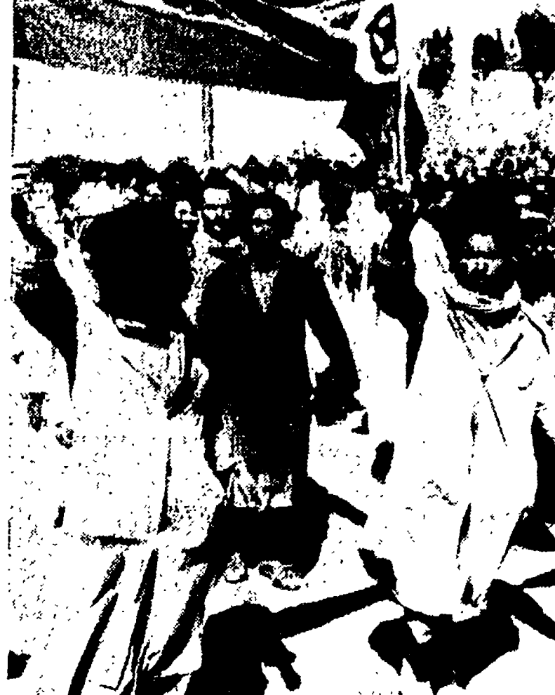
TUNISI - Partiti, ex membri delle formazioni partigiane, festeggiano a Tunisi l'indipendenza del paese

DAL NOSTRO CORRISPONDENTE PARIGI, 22. - L'Algeria ha conosciuto una nuova giornata di sangue; nelle ultime ventiquattro ore - stando ai comunicati ufficiali - cento parigiani algerini, una decina di militari francesi sarebbero morti in una serie di scontri verificatisi un po' dappertutto mentre altri 19 musulmani, civili e militari, avrebbero tro-