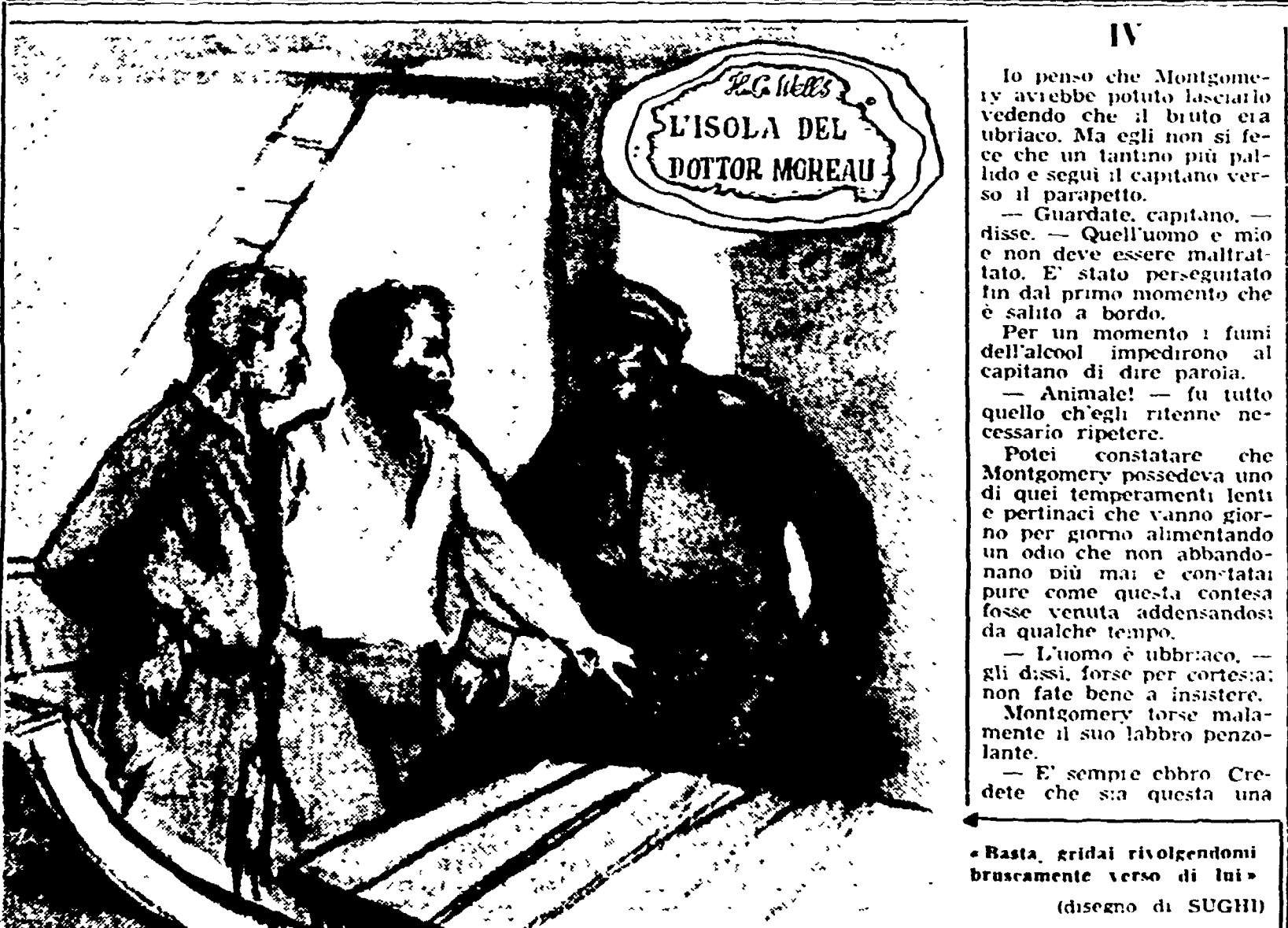
«Basta gridai rivolgendomi bruscamente verso di lui» (disegno di SUGHI)

CAVICCHI-NEUHANS IL 30 MAGGIO A BOLOGNA Sempre per l'organizzazione di Della Vita il 30 maggio a Bologna si disputerà il primo confronto fra Cavicchi e Neuhans per il titolo europeo della categoria peso massimo.