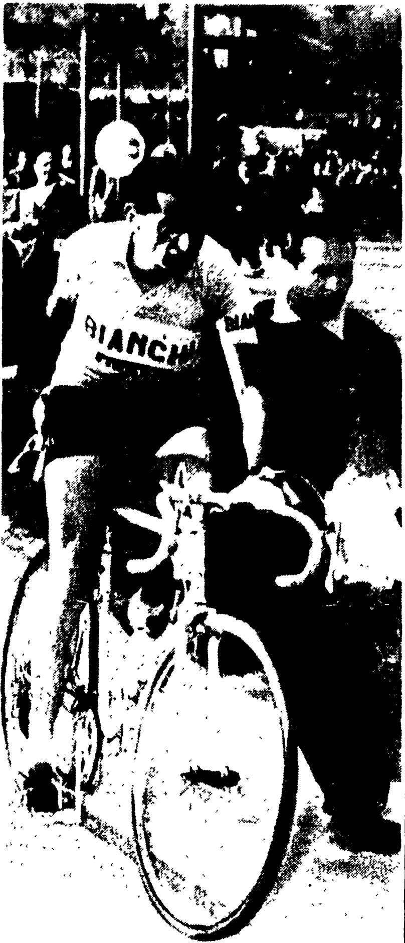
Avendo rinunciato, a causa del maltempo, al Giro di Reggio Calabria, prima prova tricolore, Coppi farà domani il suo esordio stagionale nel Giro della Campania. Fausto Coppi, più che puntare alla vittoria aggraverà le proprie forze per rendersi conto delle sue possibilità nelle future grandi corse. In alto: il campione di ciclismo, Fausto Coppi, in sella alla sua bicicletta. Nella foto: FAUSTO COPPI subito dopo il suo vittorioso arrivo nel Giro della Campania dello scorso anno.