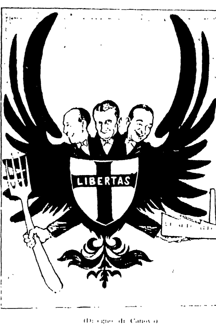
Disegno di Canova