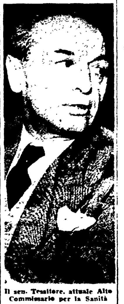
Il sen. Tesitore, attuale Atto Commissario per la Sanità

La politica di alti prezzi dei medicinali è stata determinata dalla legge n. 692, che ha dato un impulso decisivo alla produzione di medicinali. La legge n. 692, che ha dato un impulso decisivo alla produzione di medicinali.