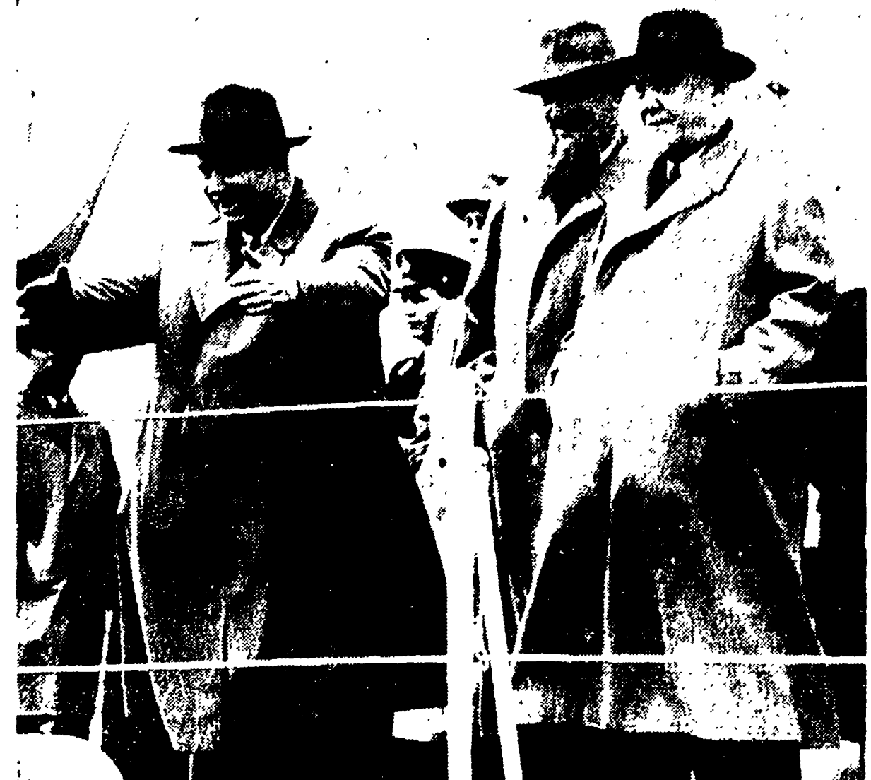
BALTISK — Krusciov, lo scienziato atomico Kurelatov e Bulganin salutano da bordo dell'incrociatore «Orgonikize» al loro ritorno in patria.