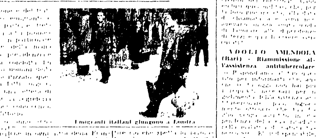
Emigranti italiani giungono a Londra.

I familiari dei lavoratori emigrati in Francia privati degli assegni. La situazione è molto difficile per le famiglie che rimangono in patria.