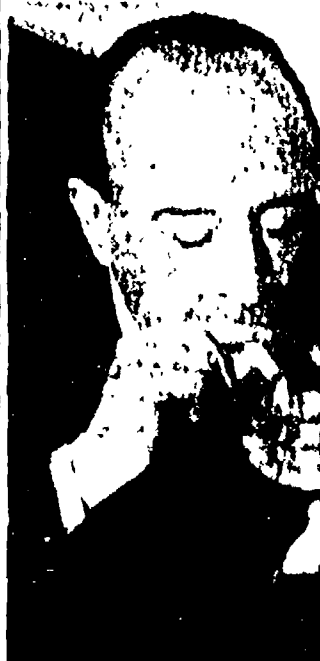
Il Conte Falina, presidente della Montecatini, è stato costretto a rinviare l'aumento del prezzo del solfato di rame.

La decisione del C.I.P. che segue alle richieste di aumento del solfato avanzate dalla Montecatini, rappresenta un grande successo della «triplice» (Cgil, Filc e Fli) e delle organizzazioni democratiche dei contadini. Va sottolineato infatti che l'azione dei consumatori e dei sindacati aveva spinto il C.I.P. a rinviare l'aumento del prezzo del solfato.