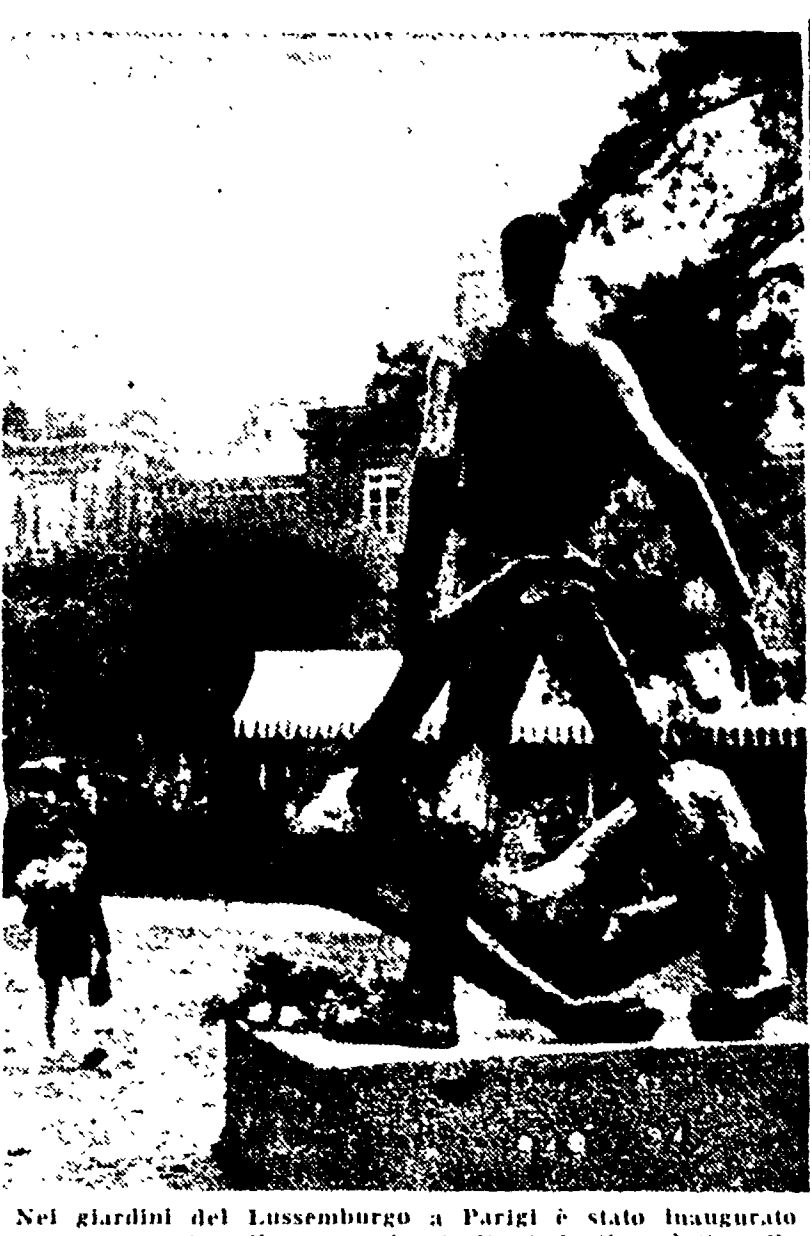
Nei giardini del Lussemburgo a Parigi è stato inaugurato un monumento alla memoria degli studenti caduti nella Resistenza...