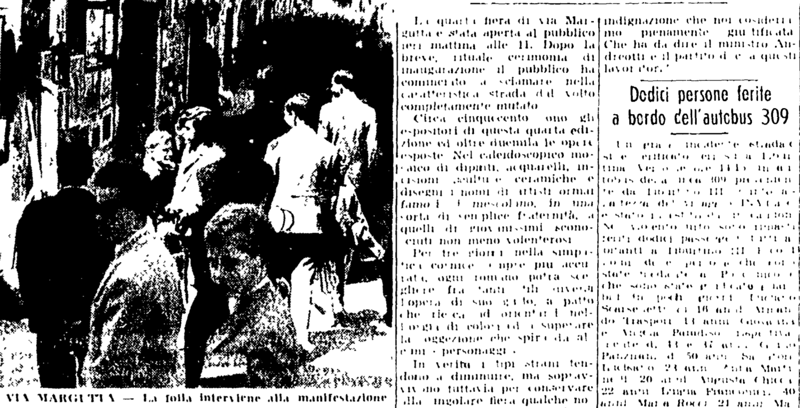
VIA MARGUTTA — La folla interviene alla manifestazione

Dipinti, sculture, ceramiche e disegni fra le 2000 opere esposte — Figure caratteristiche