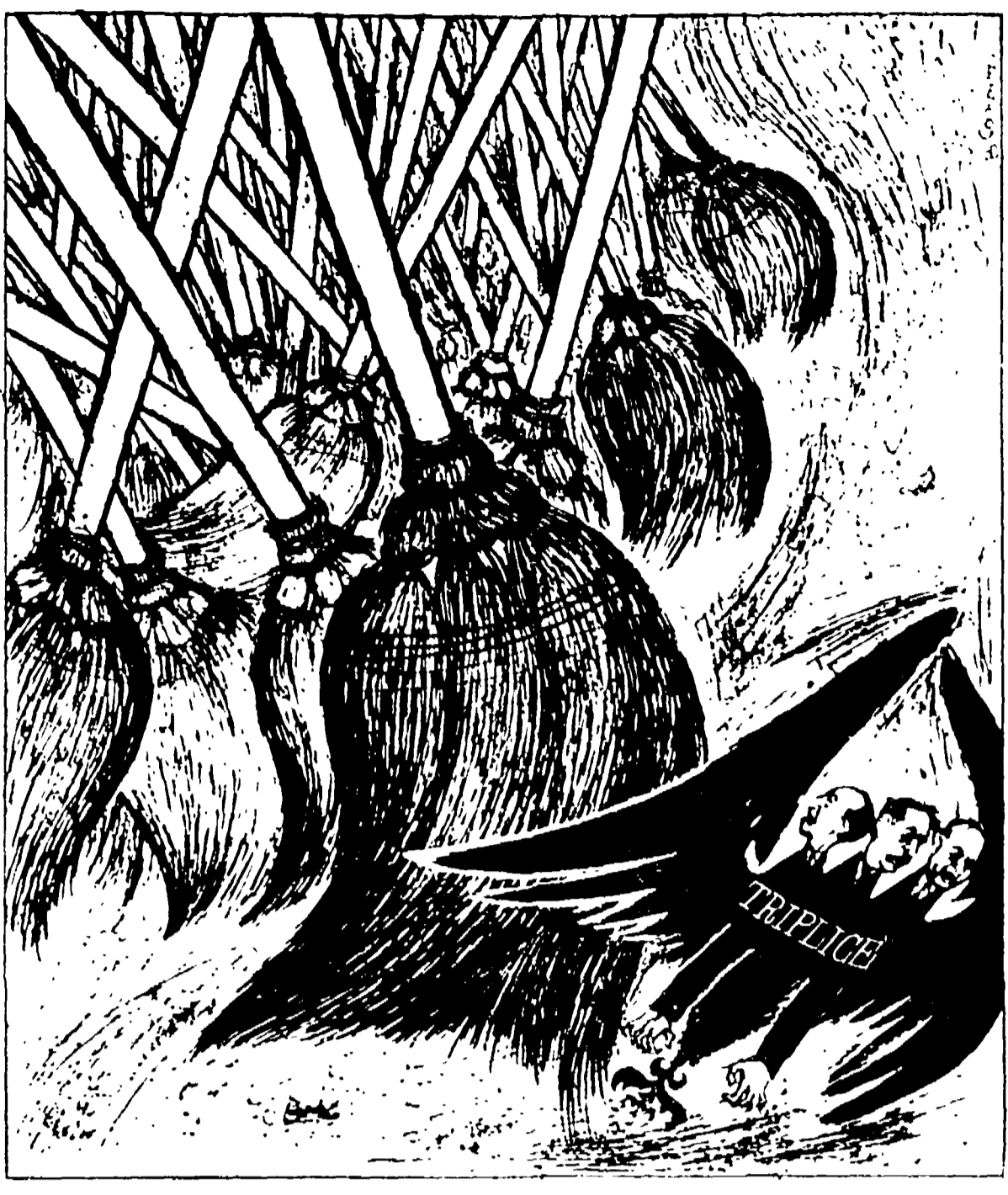
Spazzate via col voto gli uccelli di rapina che minacciano la vostra casa