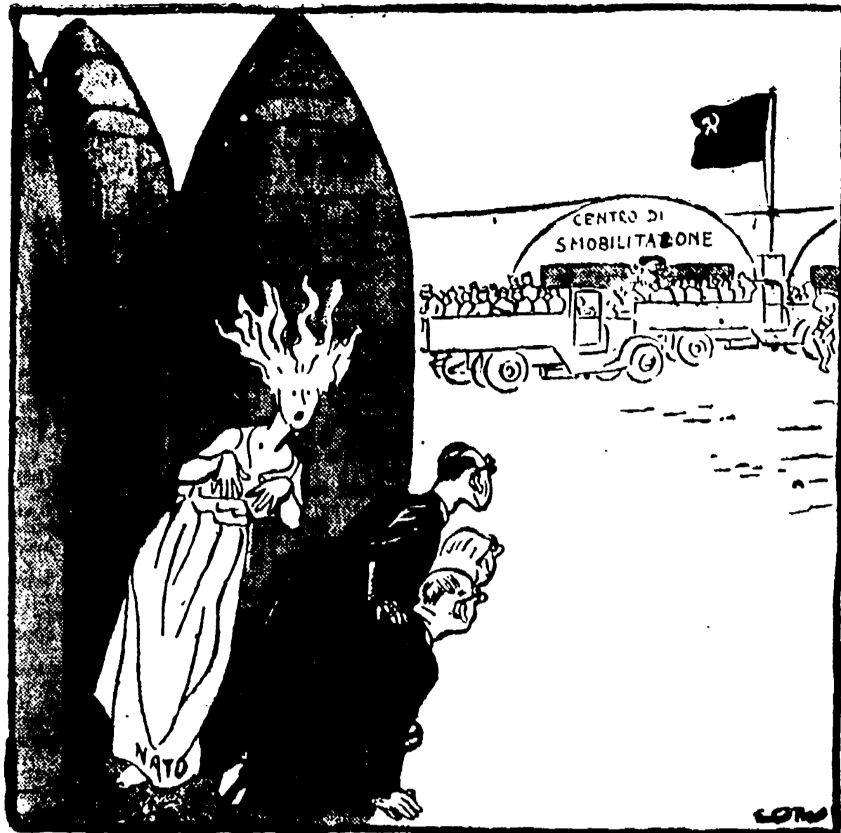
«I sovietici smobilitano senza chiedere il nostro permesso? Chi sa che cosa c'è sotto...» (Vignetta di Low, sul «Manchester Guardian»)

OGNI GIORNO NUOVI GESTI DI BUONA VOLONTA' METTONO IN CRISI I FAUTORI DELLA GUERRA FREDDA