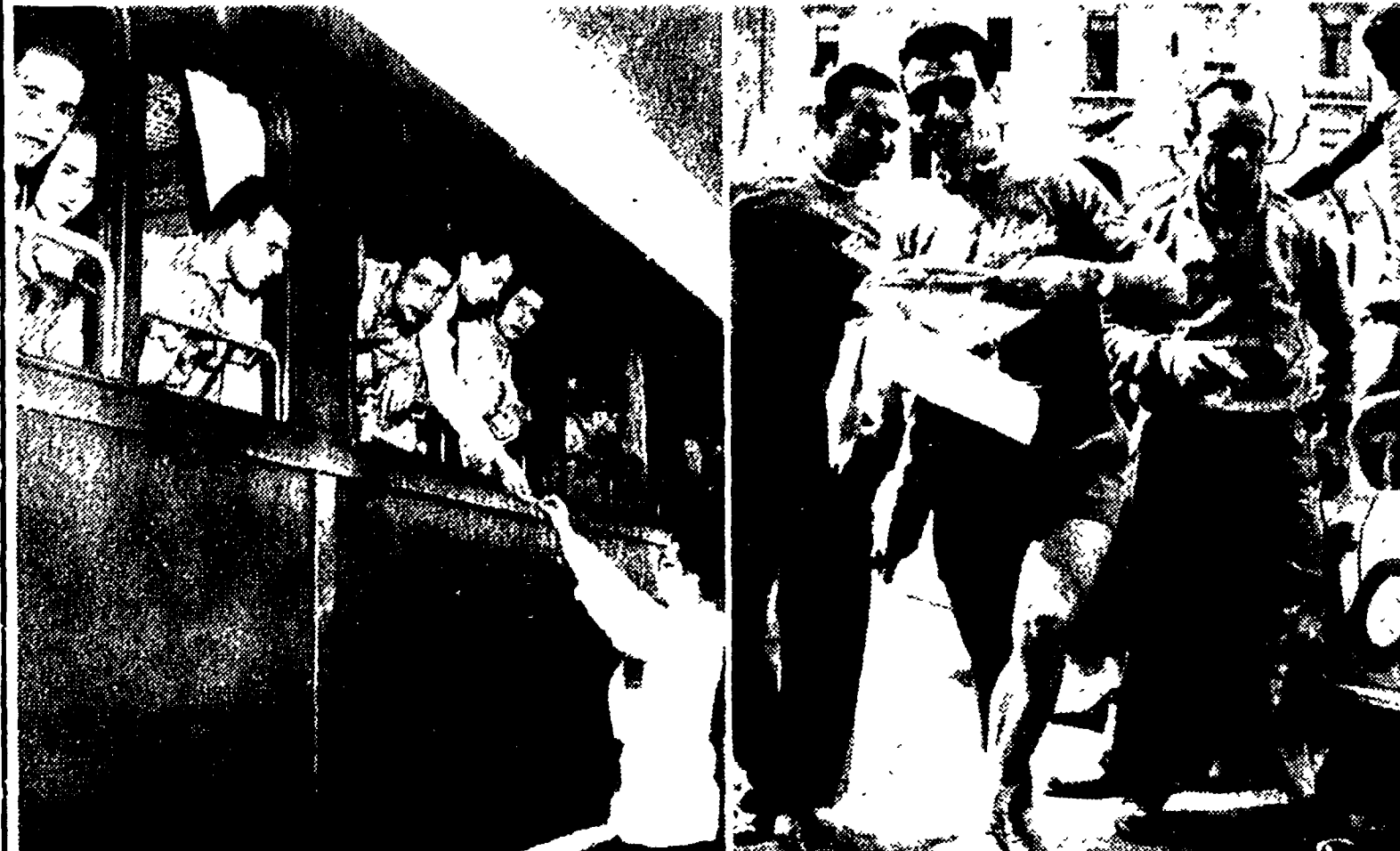
Il « Giro » è giunto a Roma in treno per la sua prima giornata di vacanze. Nella foto le squadre della Torpado e della Legnano all'arrivo alla stazione di Roma