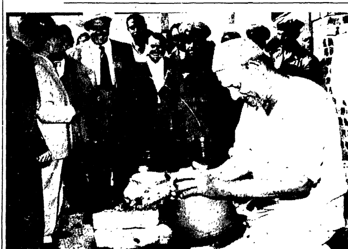
II, CAIRO - Il ministro degli esteri sovietico, Scepilov, visita la bottega di un vasallo

PARIGI, 21. - Pineau rientrerà domani dalla sua rapida tournée negli Stati Uniti e, come testimonia il comunicato conclusivo dei colloqui franco-americani, torna pressoché a mani vuote.