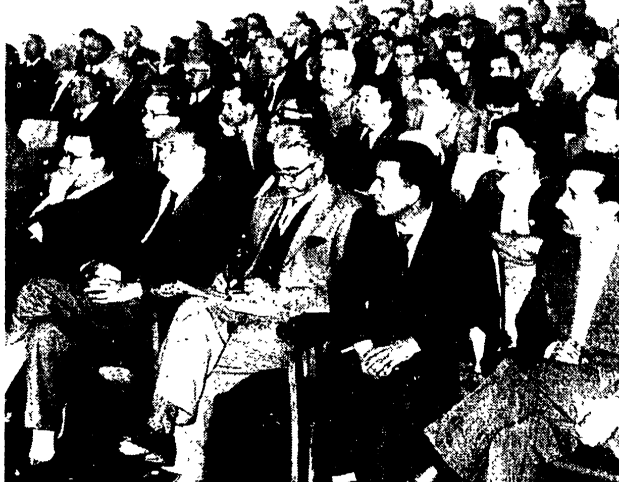
Un aspetto della sala delle riunioni a Frattocchie mentre si svolgono i lavori del C.C.