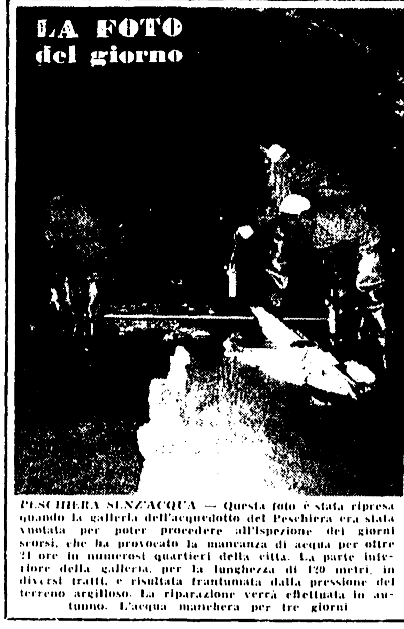
LA FOTO del giorno

PELLEGRINA SENZA CASA — Questa foto è stata ripresa quando la galleria dell'acquedotto del Peschiera era stata sfondata per poter procedere all'ispezione dei tronchi dissestati. La mancanza di acqua per oltre 21 ore in numerosi quartieri della città. La parte inferiore della galleria, per la lunghezza di 120 metri, in diversi tratti, è risultata frantumata dalla pressione del terreno argilloso. La riparazione verrà effettuata in autunno. L'acqua mancherà per tre giorni