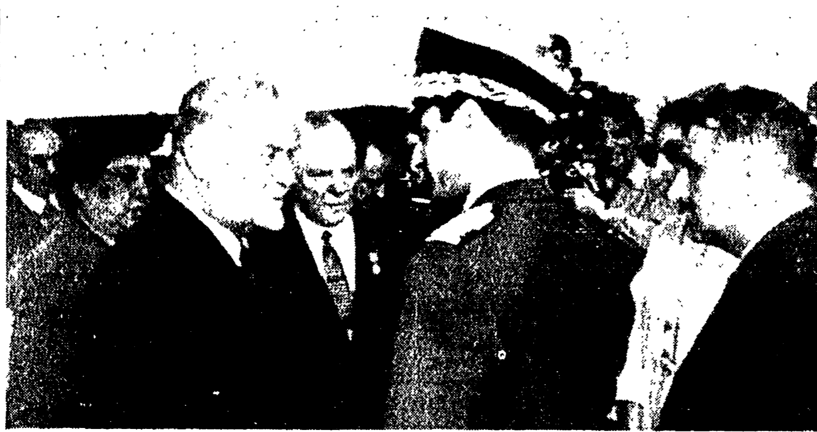
MOSCA - Il saluto di Bulganin e Vorosilov allo Scià di Persia, al suo arrivo nella capitale sovietica. A destra dietro il sovrano, è Soraya

MOSCA, 25. - Dopo i parlamentari e i presidenti del Consiglio, anche i monarchi vengono a Mosca. L'aeroporto centrale, che in un anno ha visto arrivare più monarchi e capi di governo che qualsiasi altro aeroporto del mondo, ha accolto oggi lo Scià di Persia con la regina Soraya. Dodici caccia a reazione scortavano l'apparecchio sovietico, un «Il-14», su cui s'innalza la coppia reale.