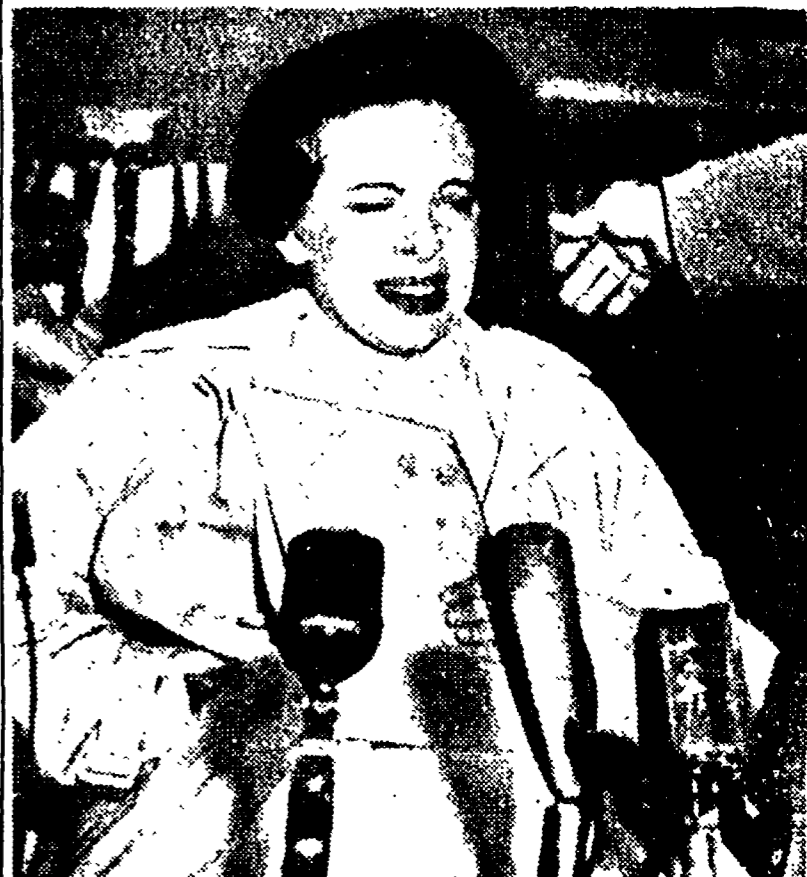
WESTBURY (New York) — La madre del bimbo rapito mentre lancia per radio il suo disperato appello (Radiofoto)

MOSCA, 6. — Uno scienziato americano, il dr. N. H. Pronko, capo della sezione di psicologia dell'Università di Tiflis, ha dichiarato ieri nel corso di un'intervista di aver osservato, durante la sua visita a Tiflis, una nuova tecnica per la misurazione delle onde cerebrali, utile per lo studio delle reazioni nervose in condizioni normali che in circostanze anormali, come quelle patologiche o quelle del volo ad alta quota.