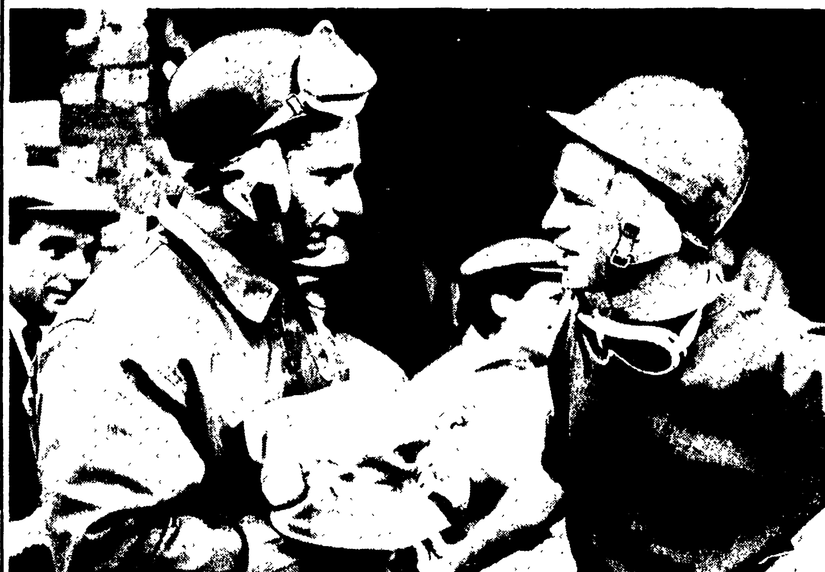
SILVERSTONE. 15. — FANGIO e COLLINS si congratulano a vicenda, dopo il G. P. di Silverstone che ha visto l'argentino Collins nella classifica mondiale e le due ultime prove (Gran Premio di Germania e Gran Premio d'Italia) dovranno risolvere la rivalità tra i due piloti. Chi la spunterà? Difficile dirlo: più facile prevedere un emozionante duello nelle ultime due prove «mondiali»

CATEGORIA 1100: 1) Siracusa, 2) Placido, 3) Mantovani, 4) Rossi, 5) Taglia-