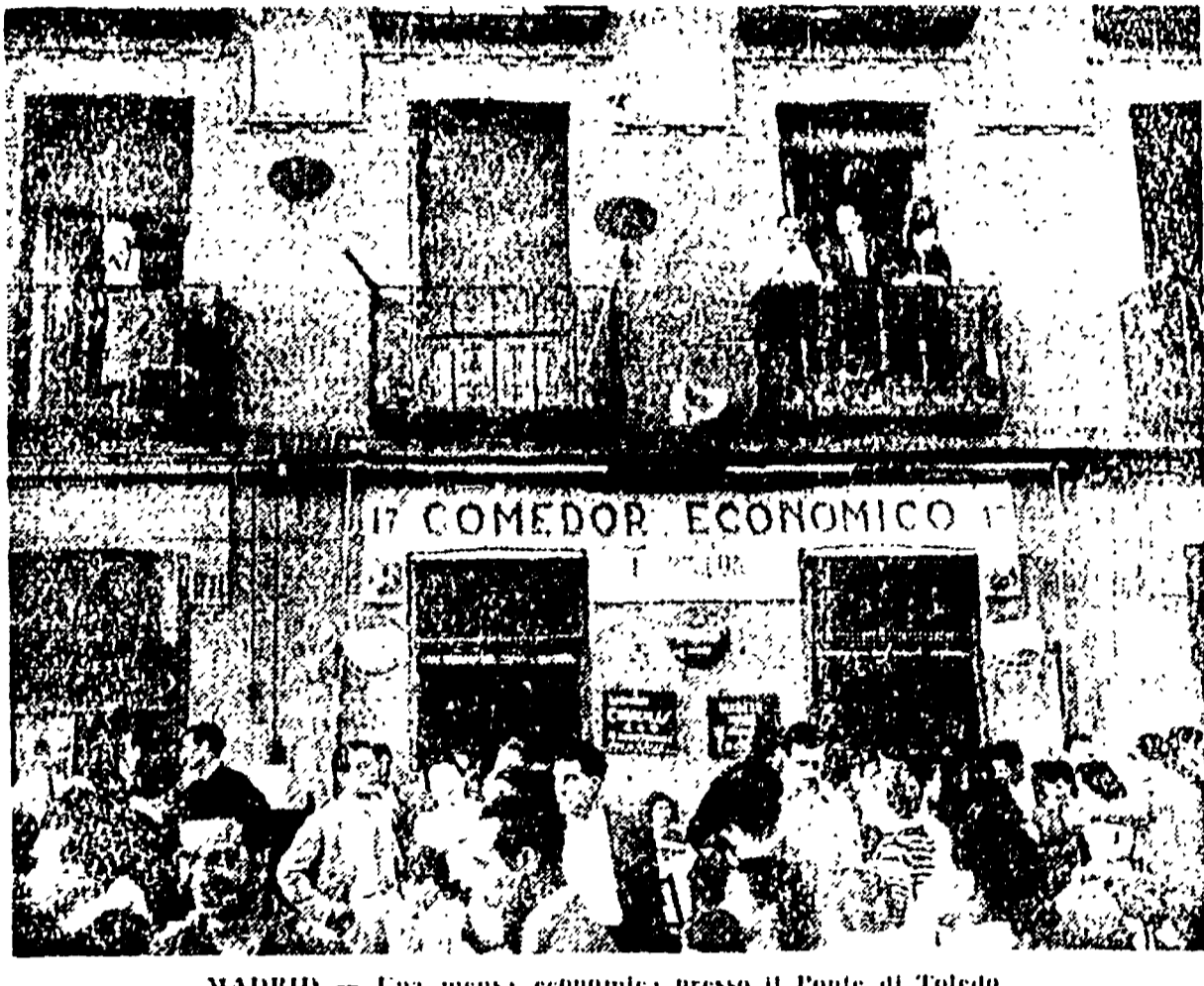
MADRID — Una mensa economica presso il Ponte di Toledo

Un assiduo del Gijón Bisogna farla piccola casertana, recando in mano un ricettacolo e si deve e verso il bagno. Spiega il capitano della polizia che si sta occupando della polizia del Gijón. Spiega il capitano della polizia che si sta occupando della polizia del Gijón.