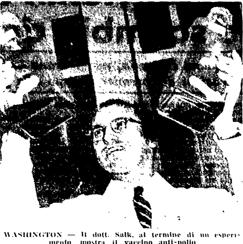
WASHINGTON — Il dott. Salk, al termine di un esperimento, mostra il vaccino anti-polio

La notizia che in Italia verrà presto introdotto il vaccino anti-polio Salk ha provocato vivaci entusiasmi in tutto il paese. Come è noto, all'istituto Sieroterapico di Napoli è stata affidata in esclusiva la fabbricazione del prezioso farmaco.