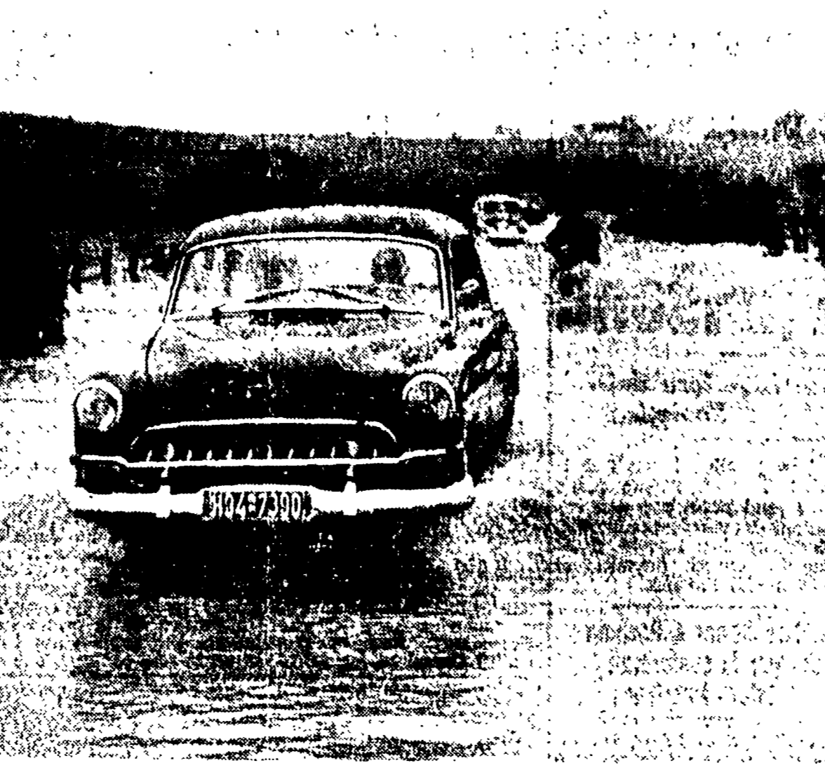
FRTZLAR (Germania) — Sei vittime si lamentano nella Germania del nord a causa degli uragani che hanno gonfiato i fiumi provocando alluvioni