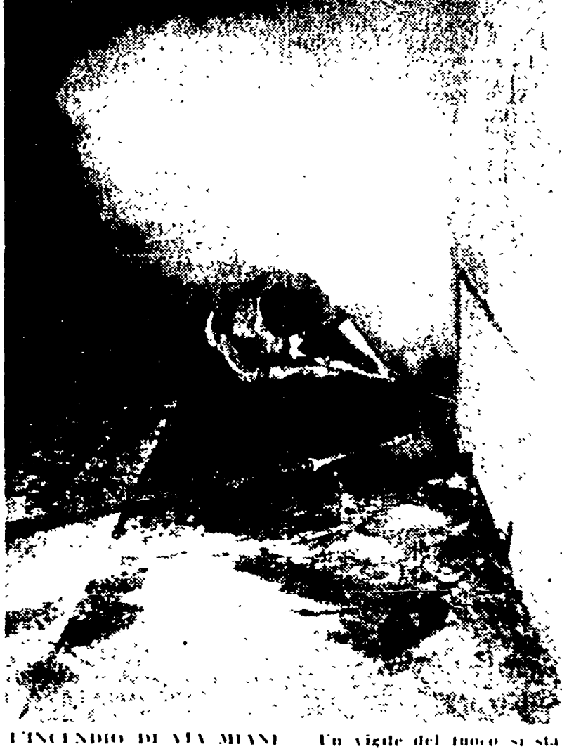
L'INCENDIO DI VIA MIANI — Un angolo del fuoco si sta avvicinando ad una griglia dalla quale esce un fumo denso e soffocante

Un altro incendio si è verificato a via Miani, dove si trovava una polveriera semidistrutta dalle fiamme. Il fuoco è stato domato dai vigili del fuoco. I danni sono stati per fortuna contenuti. Il fuoco è stato domato dai vigili del fuoco. I danni sono stati per fortuna contenuti.