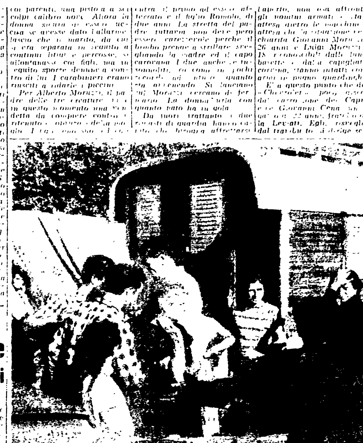
TORINO - Accanto al carrozzone di piazza Zara, ove è avvenuta la tragedia, gli zingari cominciano con il capo carovana (a sinistra) a cercare il colpevole fatto di sangue.

DALLA NOSTRA REDAZIONE TORINO. 3. - Il sangue di un zingaro, che correva la difesa di tre bambini che stavano per essere rapiti, ha arroso l'asfalto di stamani a pochi metri da un'aula scolastica nella spianata di Piazza Zara alla prima periferia di Torino, dove da circa due mesi era accampata una comunità di una tribù nomade. La tragedia, che trae le sue origini da una vicenda familiare assai complessa sorta tra gli stessi appartenenti alla comunità, è accaduta nel corso di pochi minuti alle 4.30, mentre la piazza era ancora deserta. L'intera comunità è adunata in un carrozzone romano. Un istante per far cenno agli altri che, in spallieggiato di stare allerta, quindi entra la poca luce che filtra dall'apertura del carrozzone e sufficientemente per individuare l'aggressore. Un colpo di pistola, che si ode da un'altra tribù, che si avvicina, spinge la porta e il colpo di pistola è sparato. Un colpo di pistola, che si ode da un'altra tribù, che si avvicina, spinge la porta e il colpo di pistola è sparato. Un colpo di pistola, che si ode da un'altra tribù, che si avvicina, spinge la porta e il colpo di pistola è sparato.