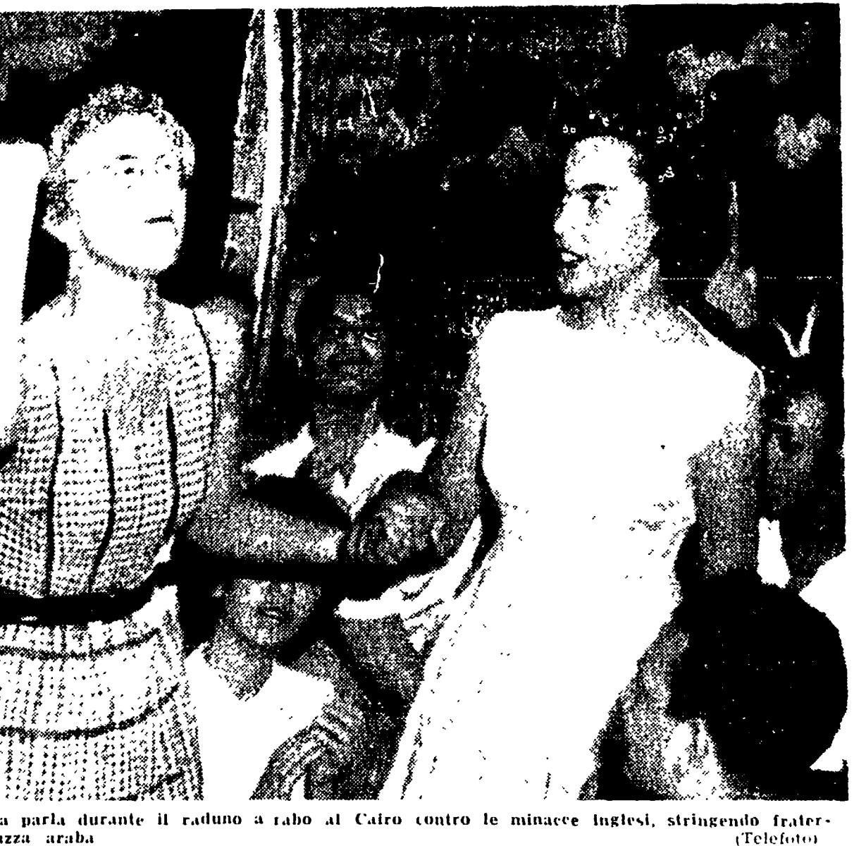
IL CAIRO - Una ragazza greca parla durante il raduno a rabo al Cairo contro le minacce inglesi, stringendo fraternalmente la mano di una ragazza araba

La Lega araba ha assunto, a base della propria politica, i cinque punti di auditing. Con questo spirito il comitato politico della Lega araba, in cui i diversi Paesi saranno per l'occasione rappresentati dai rispettivi primi ministri o dai ministri degli esteri, si riunirà al Cairo domani mattina alle sedici, per prendere visione della risposta dell'Egitto a l'invito di Londra, e decidere sulla forma in cui dovrà esprimersi il sostegno della nazione araba allo Stato egiziano, in questa prova della rappresentanza tutta. E questo, come dicevo, mi pare l'aspetto più concreto e imponente di ciò che è avvenuto qui in questi pochi giorni, sotto lo stimolo delle minacce occidentali e la prova del fatto che la preparazione della prossima dichiarazione di Nasser non è avvenuta solo sul piano della propaganda, ma costituisce un sostanziale progresso della coscienza nazionale e politica del popolo arabo.