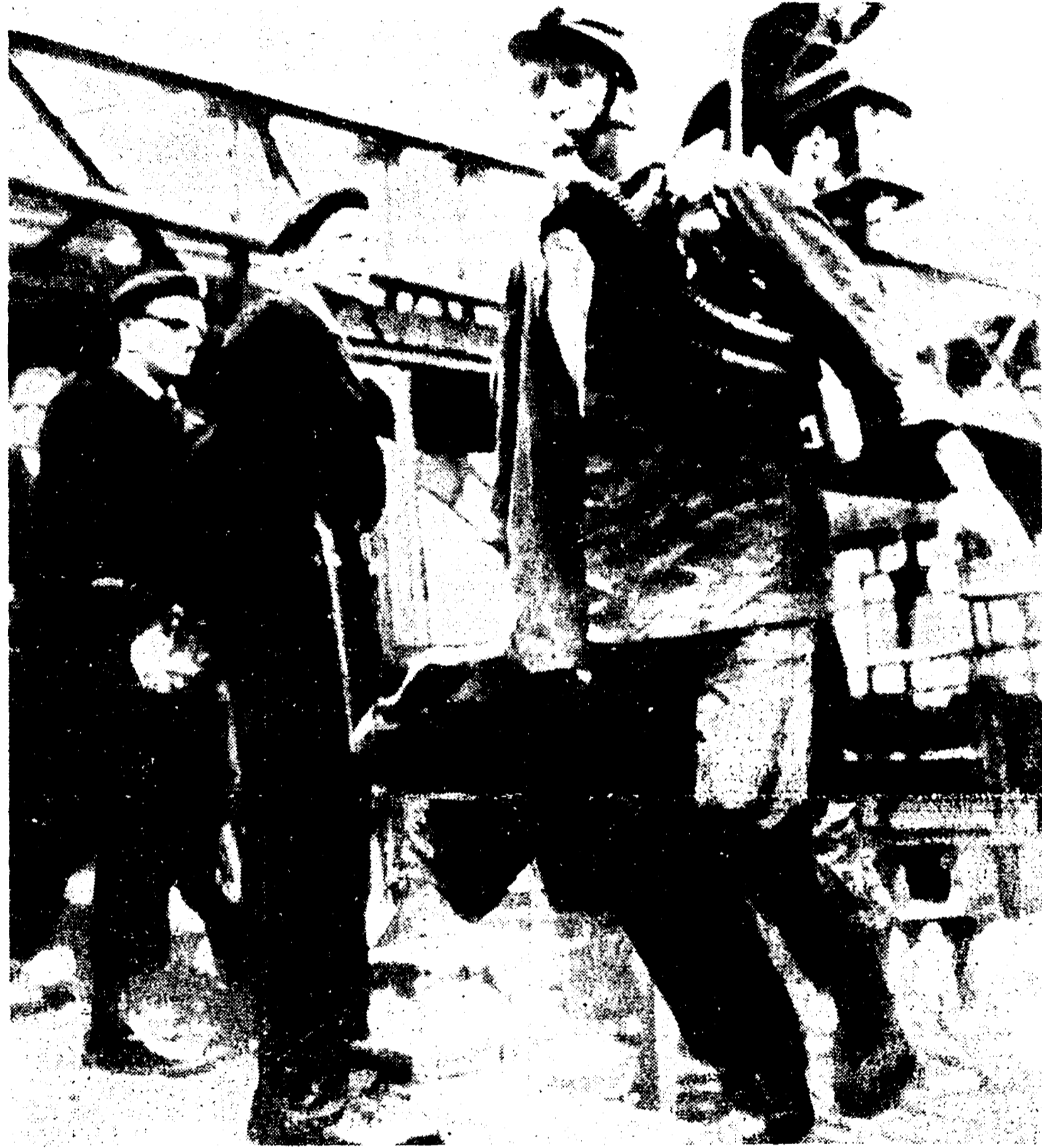
MARCINELLE - Uno dei soccorritori, appena uscito dalla miniera

Dieci cadaveri rinvenuti ieri a quota 735 - Uno sbarramento costruito fra i due pozzi al livello 907 per ridurre il fumo