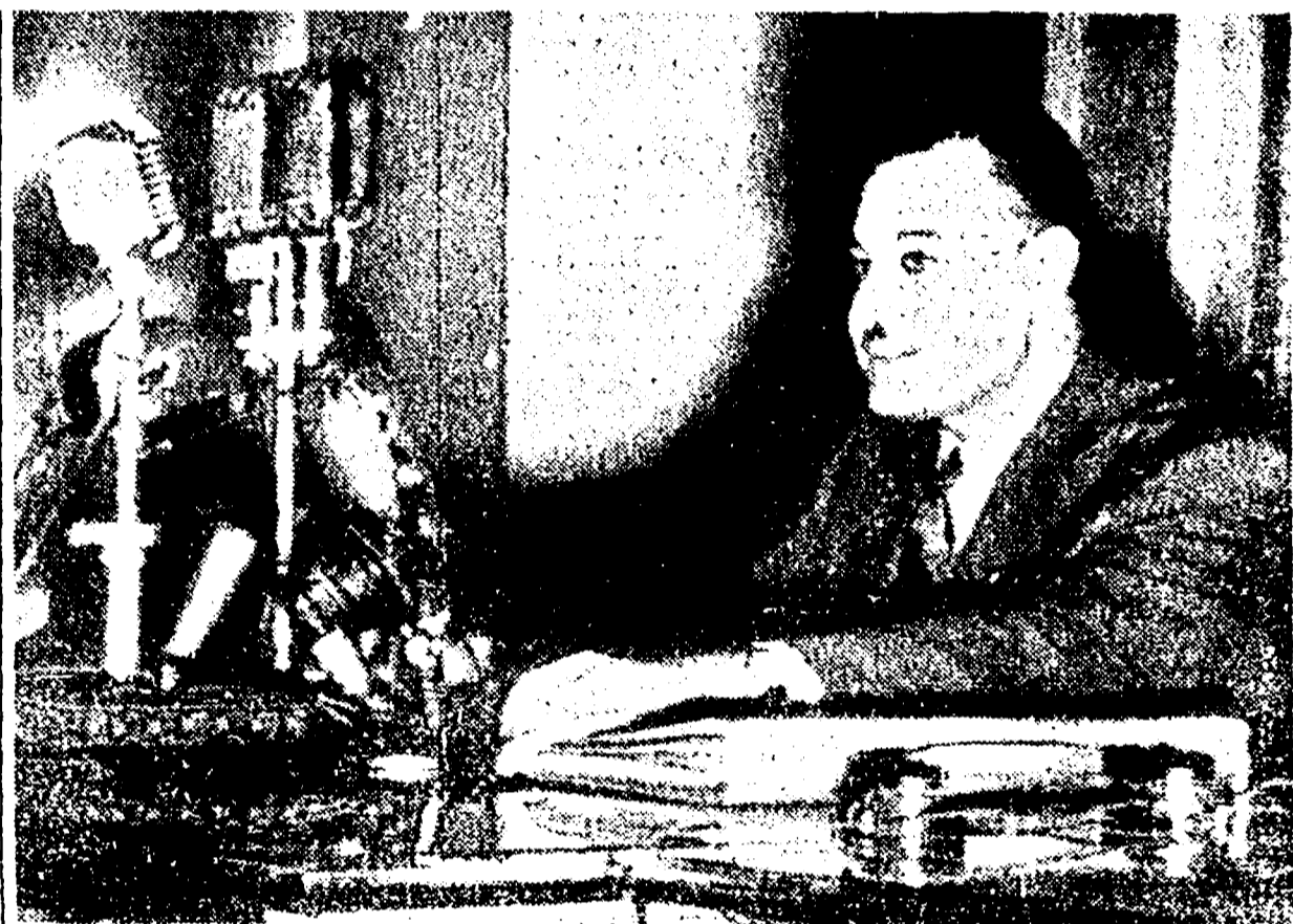
IL CAIRO - Il presidente Nasser durante la conferenza alla stampa internazionale