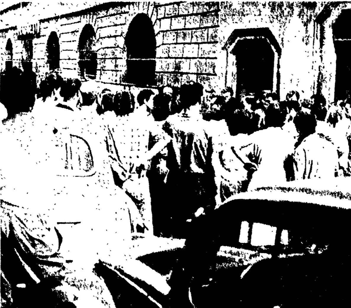
Gli agenti di P. S. sembra che abbiano avuto difficoltà a vendere alcuni prodotti di famiglia. In alto: un gruppo di agenti di P. S. che ha sequestrato un gruppo di rivenditori di prodotti di famiglia. In basso: un gruppo di agenti di P. S. che ha sequestrato un gruppo di rivenditori di prodotti di famiglia.