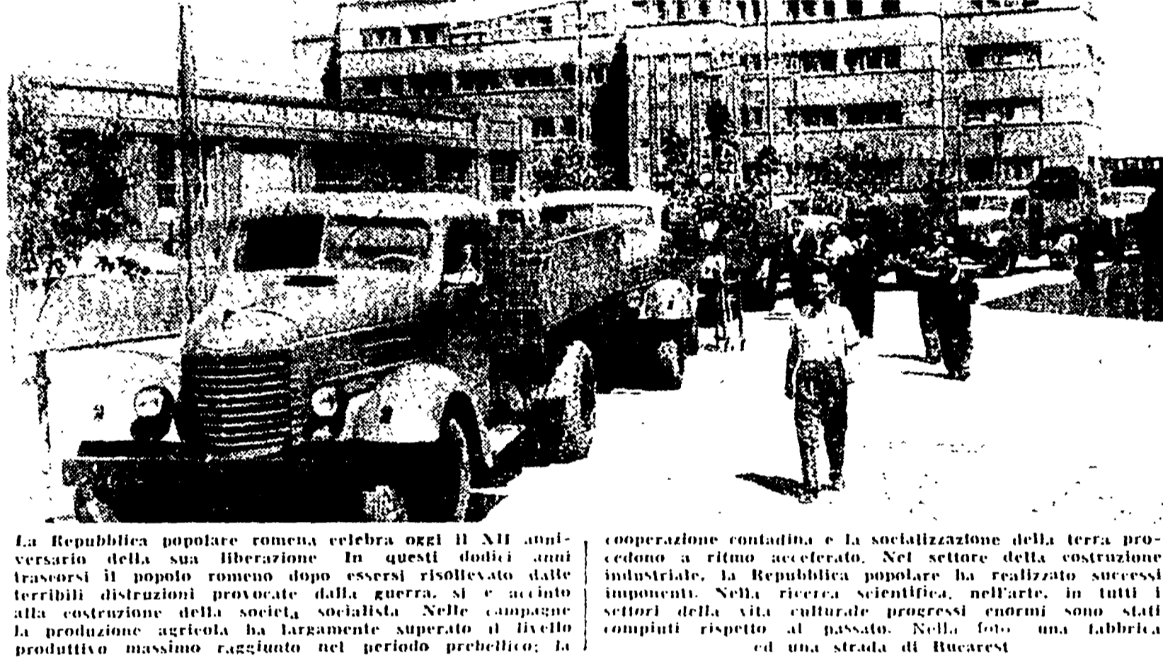
La Repubblica popolare romena celebra oggi il XII anniversario della sua liberazione. In questi dodici anni il popolo romeno dopo essersi risolto dalle terribili distorsioni del comunismo ha realizzato i successi della costruzione della società socialista. Nelle campagne la produzione agricola ha largamente superato il livello produttivo massimo raggiunto nel periodo prebellico; la cooperazione contadina e la socializzazione della terra procedono a ritmo accelerato. Nel settore della costruzione industriale, la Repubblica popolare ha realizzato successi notevoli nell'edilizia, nell'energia elettrica, nei trasporti, nella vita culturale, progressi enormi sono stati compiuti rispetto al passato. Nella foto: una fabbrica ed una strada di Bucarest.