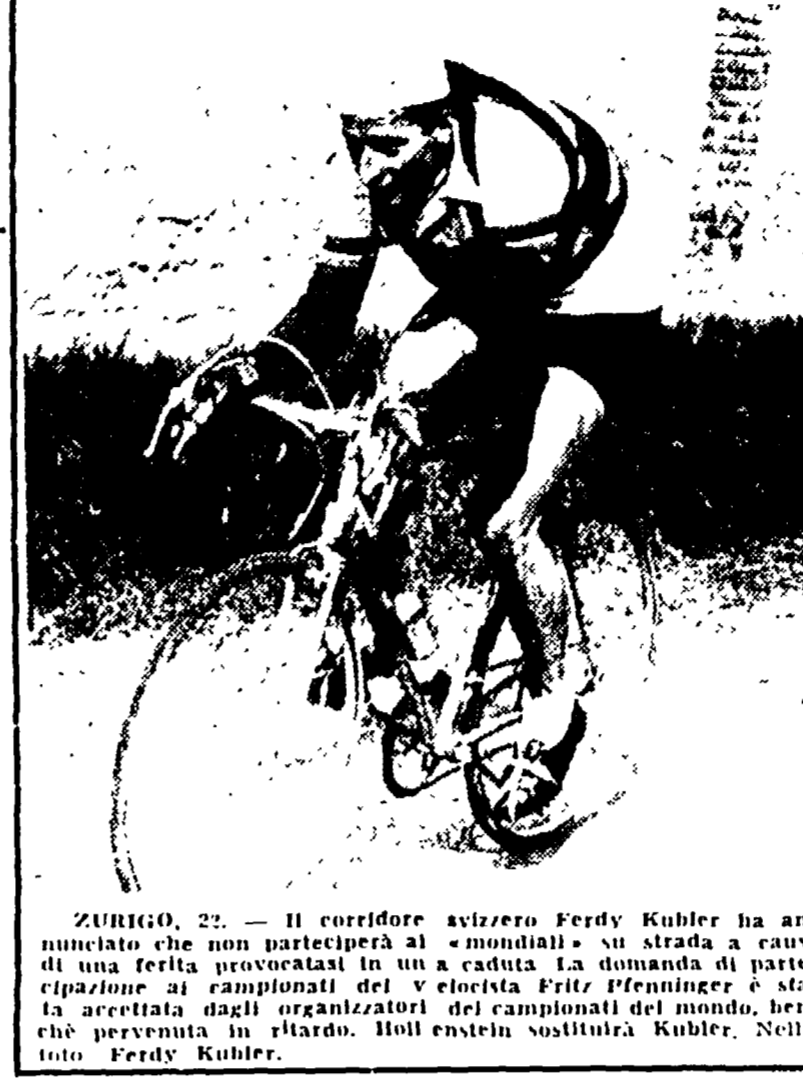
ZURIGO, 22. — Il corridore svizzero Ferdy Kubler ha annunciato che non parteciperà alla gara mondiale della strada a causa di una ferita provocata in un allenamento ai campionati del mondo. La ferita, che gli impedisce di partecipare ai campionati del mondo, è stata accertata dagli organizzatori del campionato del mondo, benché persista un ritardo. Non esiste sostituto Kubler. Nella foto Ferdy Kubler.

IMPORTANTE IL RUOLO DEGLI AZZURRI NELLA CORSA DEI « PURI »