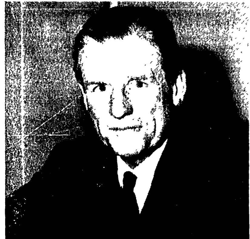
Sir John Harding, governatore inglese di Cipro

Il governatore inglese voleva esiliare i partigiani - Se le trattative per l'autogoverno non cominceranno entro lunedì l'EOKA riprenderà le armi