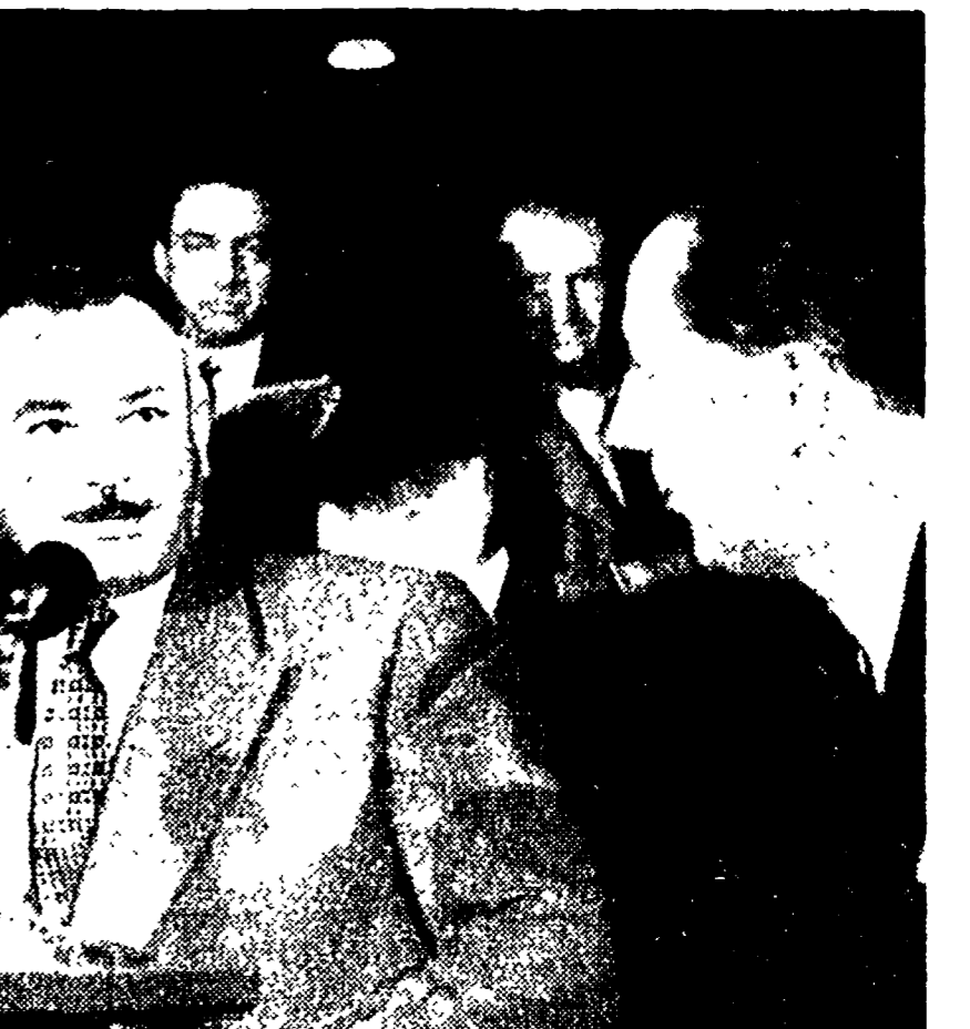
LONDRA - L'osservatore egiziano Ali Sabri, capo-gabinetto di Nasser, intervistato da giornalisti e radio cronisti