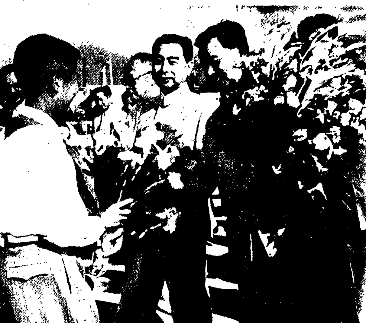
PECHINO - Il primo ministro cinese Chen En-lai (al centro) all'aeroporto insieme al principe Suvanna Fuma, primo ministro del Laos, partito per un viaggio attraverso la Cina prima di rientrare in patria.

ster Guardian afferma che l'obiettivo che si vuole raggiungere con la pubblicazione del «diario» Grivas è quello di «gettare la responsabilità della ripresa della ostilità sulle spalle della EOKA».