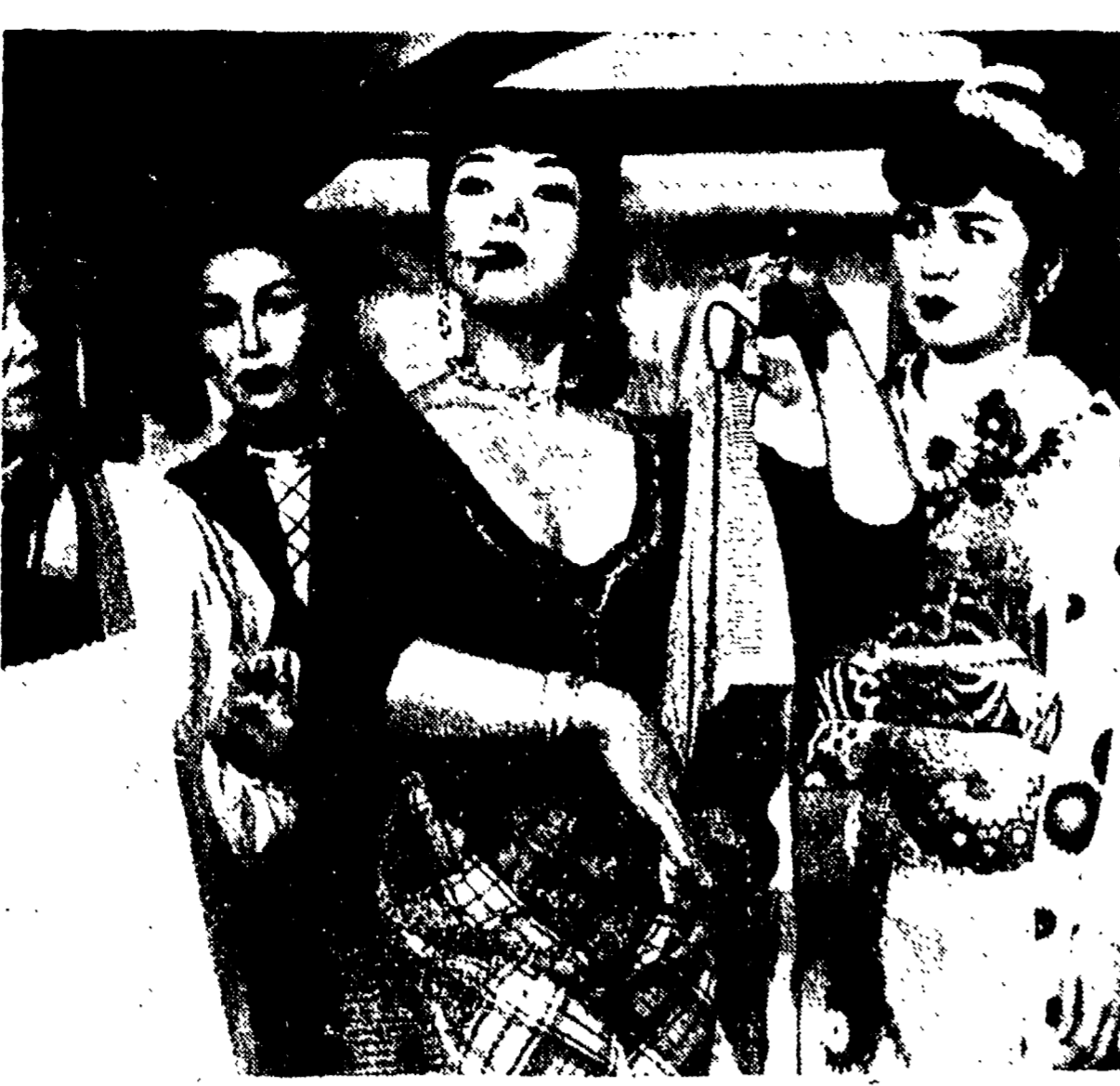
Un fotogramma della «Strada della Vergogna», l'ultimo film del regista Mizoguchi