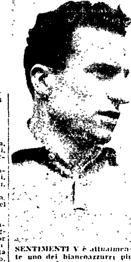
SENTIMENTI V E' attaccamento uno dei biancoazzurri più in forma