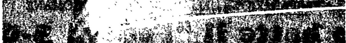
Delegazione di viticoltori sfilano per le vie del centro