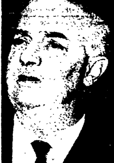
Il ministro Angelini