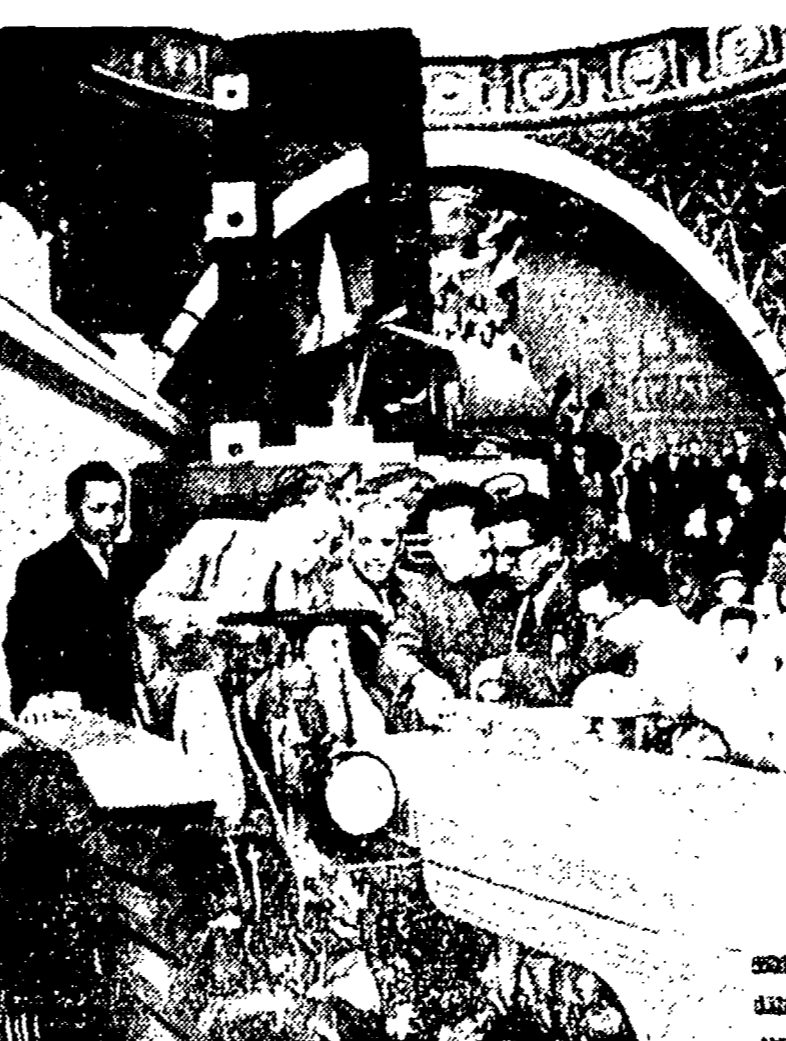
MOSCA — Una delegazione di Ceylon, guidata da sir Claude Corea, visita a Mosca l'Esposizione permanente di Agricoltura e si sotterma presso un nuovo modello di trattore

Sono passati dieci giorni, ormai, da quel 6 settembre in cui il governo di Bonn annunciò di aver aperto le porte dell'esercito agli ufficiali della S.S. fino al grado di tenente-colonnello, e il dibattito, anzi che concludersi, sta prendendo una piega sempre più animata. La discussione, per forza di cose, investe adesso tutta la politica militare, e solleva i problemi morali che non si esagera a definire drammatici. «Un cittadino tedesco», come volontari, nelle S.S.». Tutti si rendono conto, a questo punto, che i pochi, in questi «cittadini», impiecati al ministero della Difesa hanno ormai perso la partita, e non riusciranno mai a fare della Bundeswehr un esercito democratico. Nelle forze armate di Bonn domina, qui appoggiato, lo spirito del Terzo Reich. La ha riconosciuto anche la Frankfurter Rundschau, in un editoriale dal titolo «Il grande pericolo», in cui ha rivelato che nelle scuole per ufficiali ufficiali sono all'oggi le lezioni sul tema: «La patria perduta fra Weichsel e Memel».