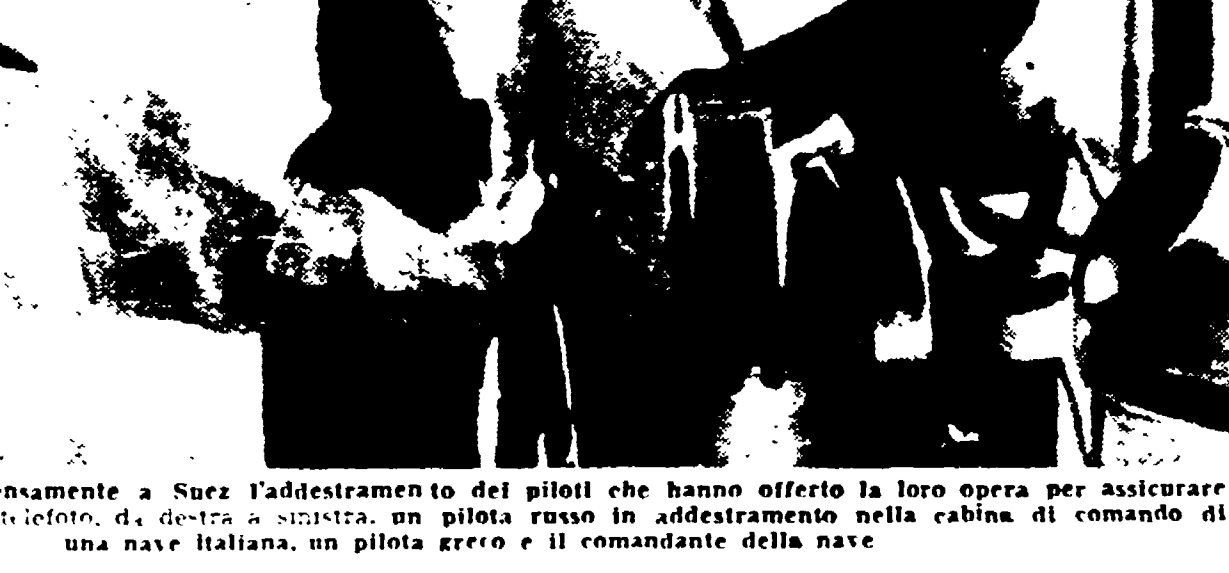
Il CAIRO — Prosegue intensamente a Suez l'addestramento dei piloti che hanno offerto la loro opera per assicurare il traffico sul Canale. Nella foto, da sinistra, un pilota russo in addestramento nella cabina di comando di una nave italiana, un pilota greco e il comandante della nave