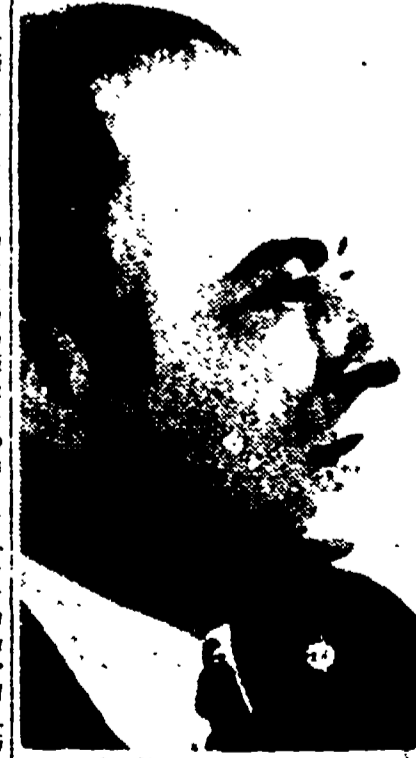
Il dittatore Somoza

L'attentato è stato commesso nella città di Leon durante una festa danzante alla quale il presidente, la consorte ed il figlio, capo della Guardia nazionale, assistevano all'interno della « Casa dei lavoratori ». L'aggressore si è infiltrato in un gruppo di persone raccolto intorno al presidente, che sedeva su una poltrona su di un lato della sala, e ha sparato contro di lui l'incasso caricatore.