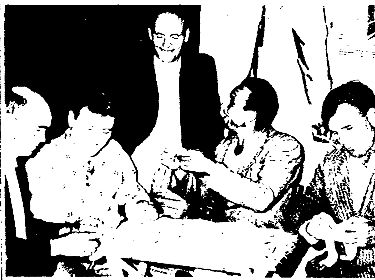
CAMPAGNANO - Compagni della sezione comunista contano i versamenti della sottoscrizione.

La Direzione del Partito si riunirà oggi per discutere la relazione di Longo al Comitato centrale. La riunione sarà presieduta dal compagno Longo, e sarà aperta dalle parole di benvenuto del compagno Longo.