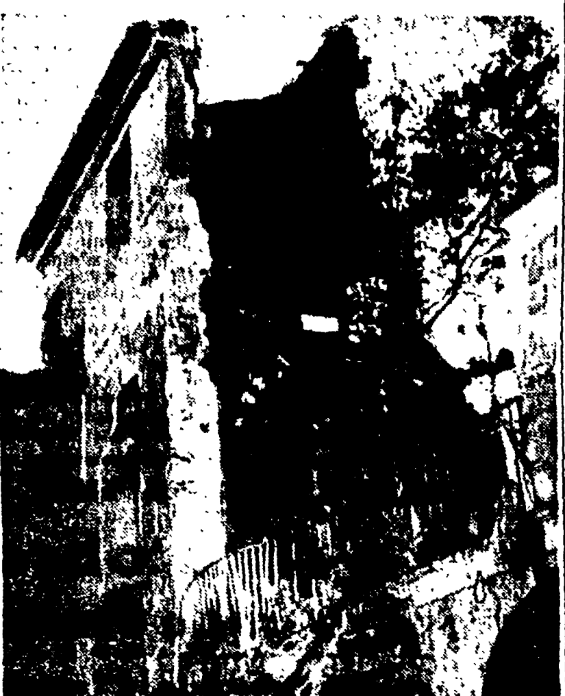
NAPOLI - Lo stabile distrutto dall'esplosione a Carmignano.

Una manifestazione dei mutilati di guerra asserragliati nella Casa Madre di Roma.