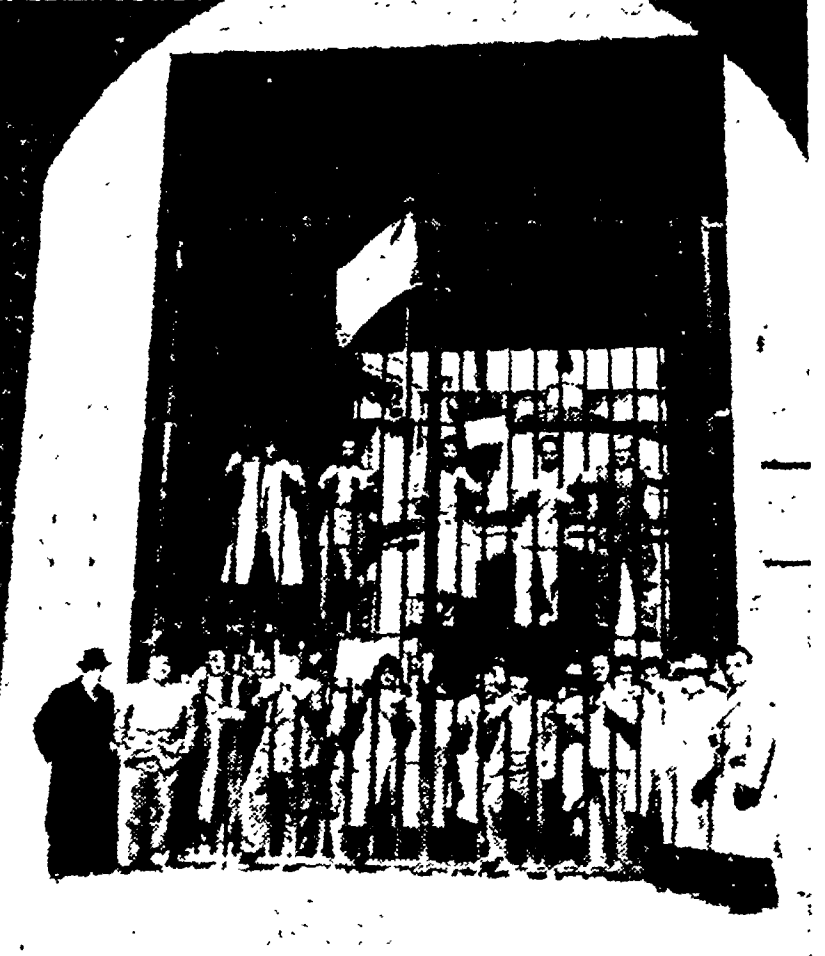
Una manifestazione dei mutilati di guerra asserragliati nella Casa Madre di Roma.