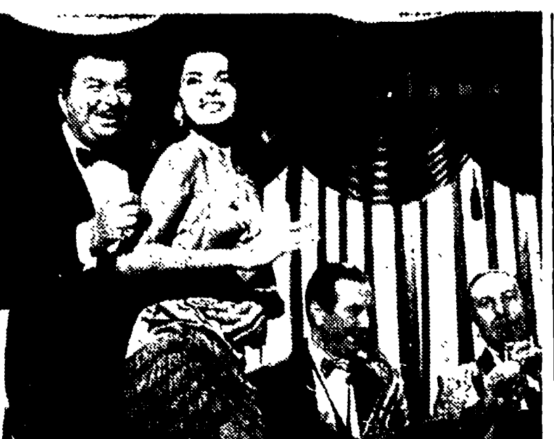
ABBE LANE e XAVIER CUGAT in una inquadratura del film in Cinemascope e technicolor «DONATELLA».

«DONATELLA» presentato al Festival Internazionale di Berlino da un film presentato con la migliore interpretazione femminile attribuito all'ex Industriale ELISA MARTINELLI protagonista del film stesso. «DONATELLA» sarà presentato su tutti gli schermi italiani nei prossimi giorni.