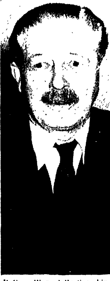
Il Cancelliere dello Scacchiere Harold Macmillan