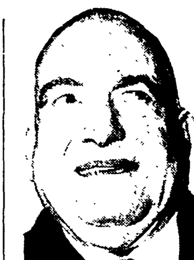
LIONELLO EGIDI: Fu sospeso dall'incarico di questore di Roma nel 1954. Fu arrestato il 19 febbraio 1956.