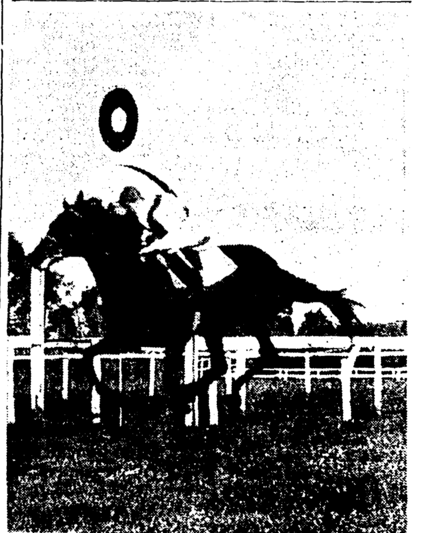
Una foto storica: l'ultimo galoppo di RIBOT

trovato un passaggio interno. In dirittura si presentava per primo Gail ma alla sua sella era Tissot che lo dominava risolutamente mentre Kojé superava Stelio e si gettava all'inseguimento dei due battistrada. Al primo il gioco era fatto: Gail, frustrato disperatamente da Parravano, resisteva in modo commovente ma Tissot in- calzava con azione facile e pacifera ed alle prime ribatte passava irresistibilmente per portarsi quindi allo steccato come un trionfatore. Gail resisteva in modo commovente