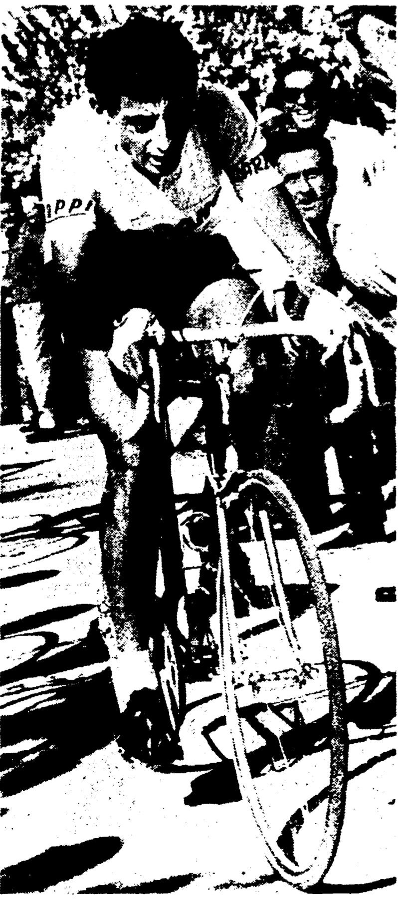
Ancora una volta COPPI è stato preceduto per un soffio sul traguardo; ma ancora una volta si è dimostrato il migliore

Ma è noto, le "giostre" non fanno danno nella classifica del "Trofeo Baracchi" come è giusto che sia. Pertanto fatti i conti è risultata vincente la coppia Graf-Darrigade, la coppia — cioè — che il successo se l'era sudato e guadagnato nella gara contro il tempo. Felicità di Graf e Darrigade mentre Coppi appariva stizzito.