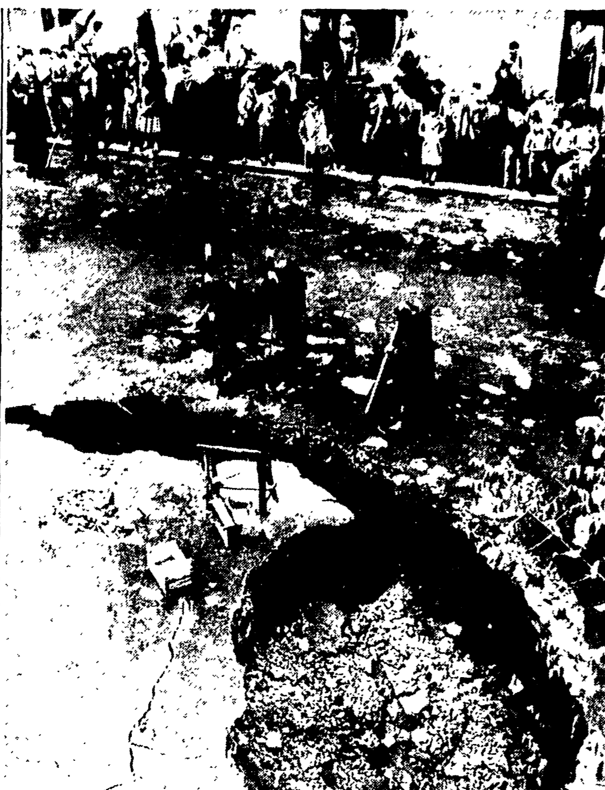
IL BARATRO — I vigili demoliscono i bordi della fossa aperta in via Da Giussano