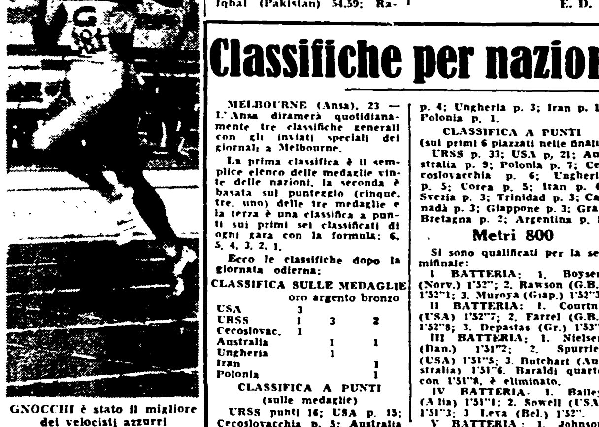
GNOCCHI è stato il migliore dei velocisti azzurri

MELBOURNE, 24 ore 12 (ore 3 italiane). — Il tempo sembra essersi voltato al meglio per la seconda giornata di gare olimpiche, ma come ogni medaglia anche il tempo ha il suo rovescio. La temperatura infatti è immediatamente salita di parecchi gradi, raggiungendo sin dai mattino i punti di parecchi gradi superiori alla temperatura media registrata ieri.