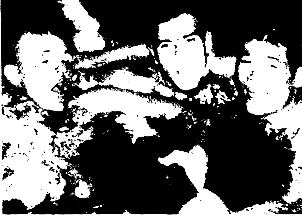
I nuotatori Breen (USA) e Yamanaka (Giappone) si congratulano con l'australiano Murray Rose al centro dopo la sua vittoria nei 400 m. stile libero

La statunitense Pat Mc Cormick bissa il successo di Helsinki nei tuffi - Ai tiratori sovietici Romanenko e Bogdanov le medaglie d'oro nel tiro al cervo e nella carabina libera - Angelo Romani si è classificato ottavo nella finale dei 400 metri stile libero