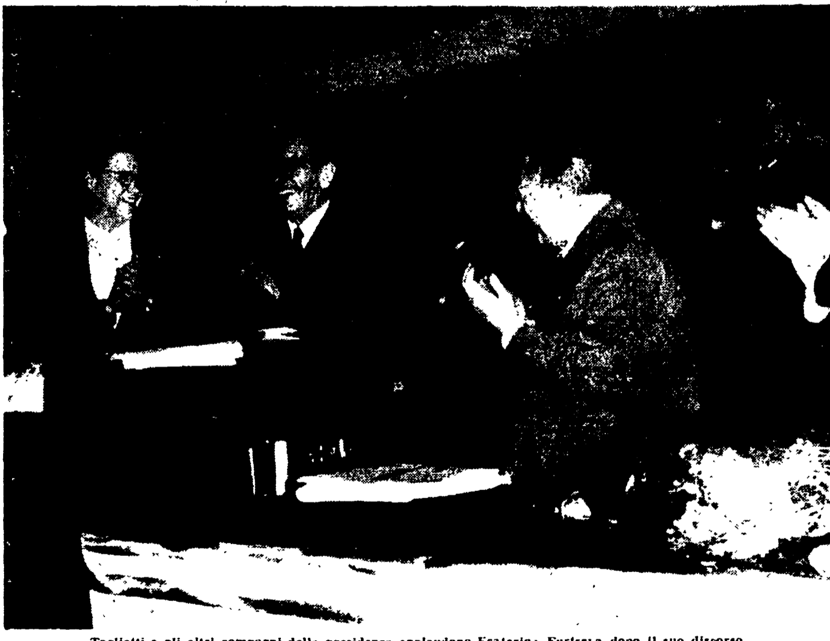
Togliatti e gli altri compagni della presidenza applaudono Ecaterina Furtseva dopo il suo discorso