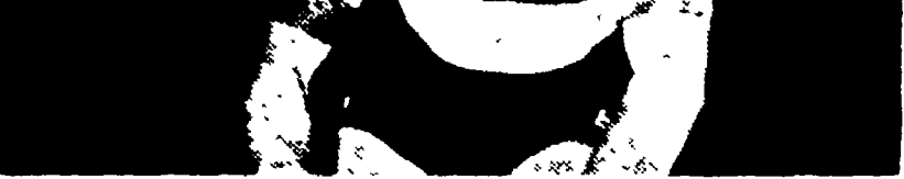
MASPES è sicuro di dimostrare la sua innocenza

«Ho letto diversi giornali in proposito. Penso che quasi certamente l'U.V.I. chiederà in forma ufficiale alla Federazione Ciclistica internazionale di aprire un'inchiesta al fine di chiarire le cose, in quanto non possiamo permettere che sussistano dubbi di questo genere a invalidare la vittoria di un nostro atleta ai campionati del mondo».