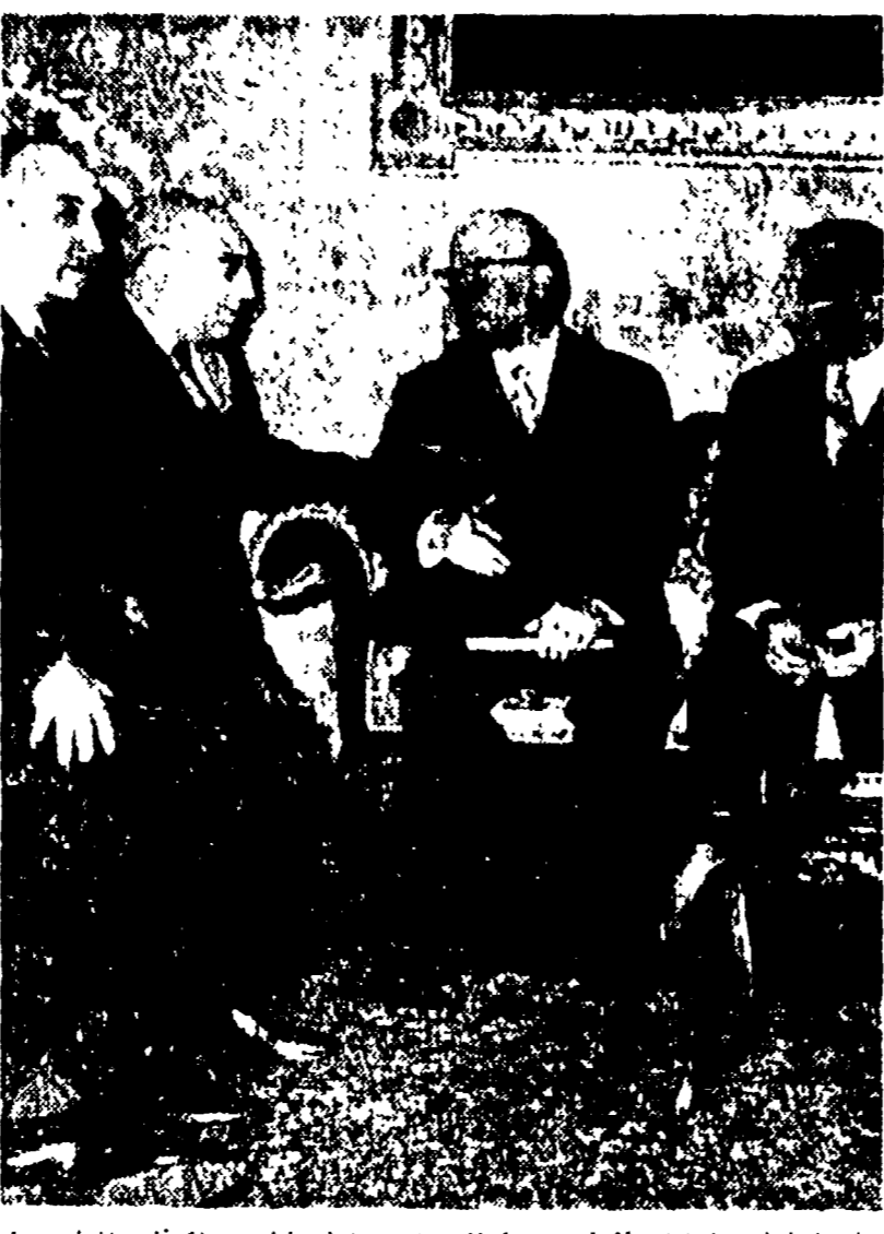
La visita di Gronchi al Senato; il Capo dello Stato si intrattiene con i vicepresidenti Molè e Santinoro e con Merzagora